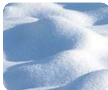
UltraPure Silica Gel イメージ